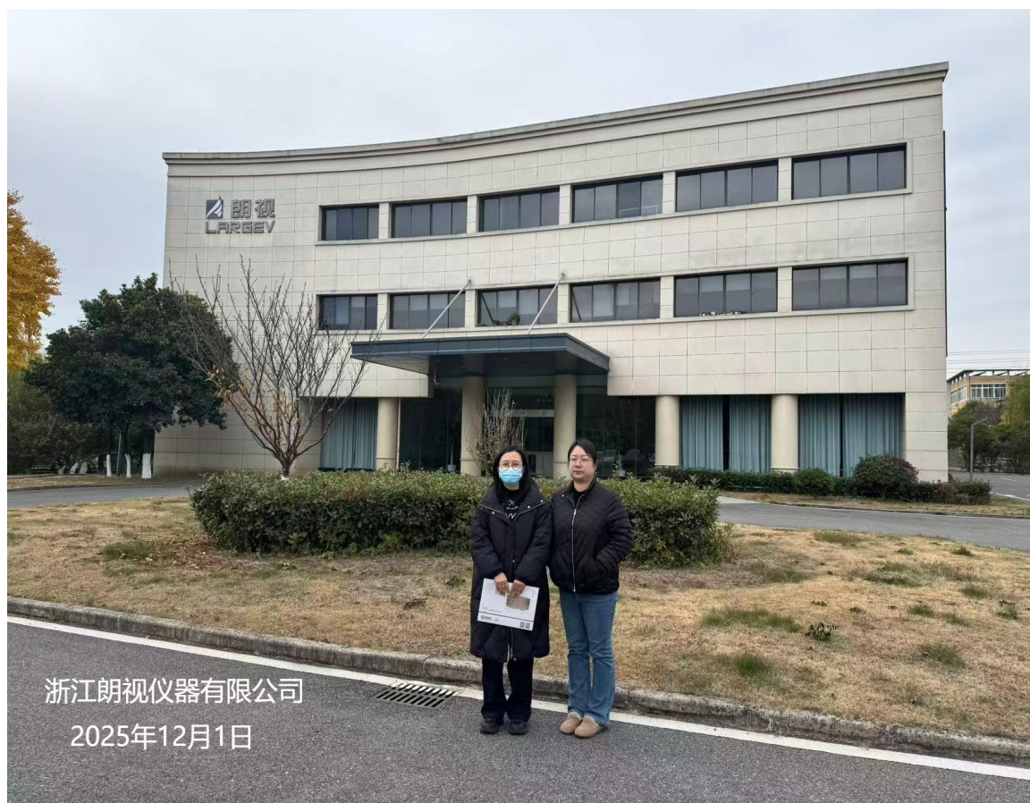
浙江朗视仪器有限公司 2025年12月1日