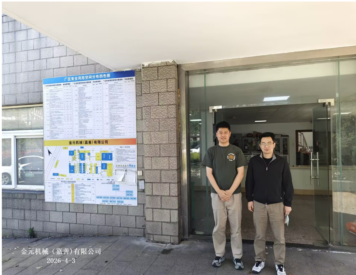
金元机械(嘉善)有限公司 2026-4-3